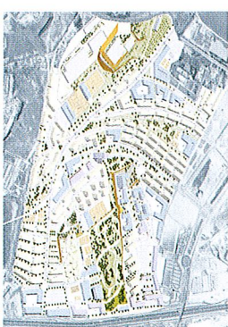
Imagen de la perspectiva general de la zona de estudio